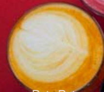
Rote Bete & Kakao Latte 9 3,75