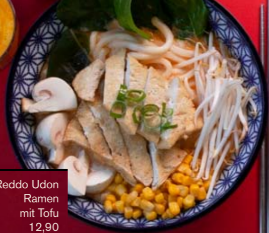
Reddo Udon Ramen mit Tofu 12,90